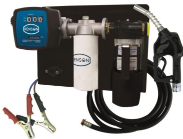
Station de transfert fuel 12V / 24V

Lire avant de procéder à l'installation et à l'emploi du groupe de transfert ou de la station