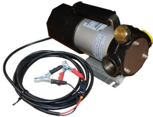
Pompe fuel 12V / 24V