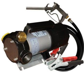
Groupe de transfert fuel 12V / 24V