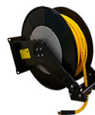
ENROULEUR AIR COMPRIME EQUIPE FLEXIBLE 30M EN 1/2"