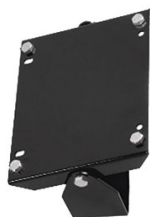
SUPPORT MURAL PIVOTANT POUR ENROULEUR ACIER