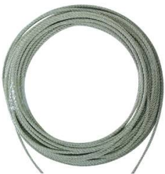
METRE DE CABLE ACIER INOX DIAMETRE 4MM