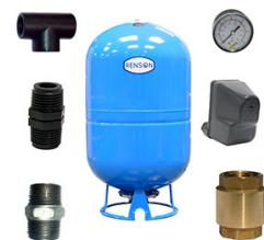
KIT RESERVOIR VERTICAL 300L POUR POMPE FORAGE 1"1/4