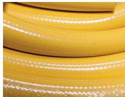
TUYAU ARROSAGE - COURONNE 25M DIAMETRE INTERIEUR - 30 MM