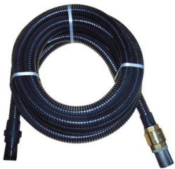
KIT ASPIRATION 8M Ø 32MM MALE 1" AVEC CREPINE A CLAPET