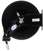
ENROULEUR ACIER POUR GRAISSE EQUIPE FLEXIBLE 15M EN 1/4"