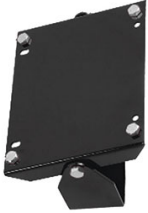
SUPPORT MURAL PIVOTANT POUR ENROULEUR ACIER