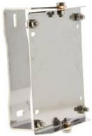
SUPPORT MURAL PIVOTANT POUR ENROULEUR INOX