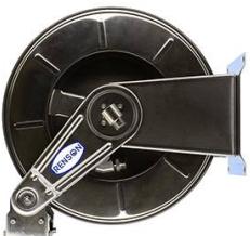
ENROULEUR INOX POUR GASOIL EQUIPE FLEXIBLE 8M EN 1"