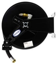
ENROULEUR ACIER POUR GASOIL EQUIPE FLEXIBLE 8M EN 1"