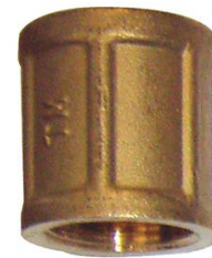
MANCHON LAITON FF 1"