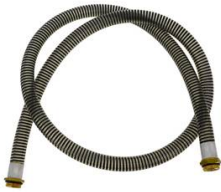
FLEXIBLE DE JONCTION Ø 25MM 2M AVEC RACCORD TOURNANT