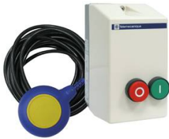
KIT MARCHE ARRET AUTO 2,5-4A AVEC FLOTTEUR 20M