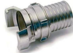
1/2 RACCORD CANNELE ALU VERROU DOUILLE REDUITE DN50