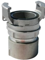
1/2 RACCORD FEMELLE ALU AVEC VERROU DN50 2"