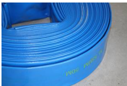
TUYAU PLAT - COURONNE 50M DIAMETRE INTERIEUR - 50 MM