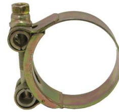
COLLIER DE SERRAGE TOURILLON W1 ACIER ZINGUE DIAMETRE 56-59