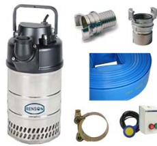
COFFRET POMPE 825130 KIT ACCESSOIRES 825145