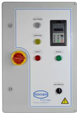
ARM PRESS CONST 2,2 KW <100M CAPTEUR CABLE 10M