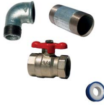
KIT DE PURGE 500 LITRES