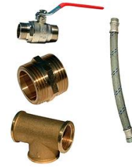
KIT BY-PASS 1" LAITON