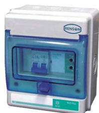
COFFRET CONTRÔLE REMPLISSAGE COLLECTEUR DE GOUTTIERE POUR CUVE A EAU