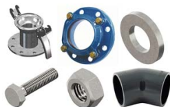
KIT DE LIAISON POUR POMPES SUPER ET SUPER ME 150