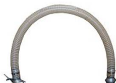
KIT DE RACCORDEMENT POUR POMPES SUPER ET SUPER ME 150