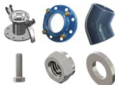
KIT DE LIAISON POUR POMPES SUPER ET SUPER ME 120