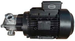
POMPE ROTOR FLEXIBLE TRI 1,1KW