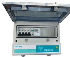
RADIO BOX 1CH-ALIM 400VAC 16A + TELECOMMANDE PORTEE 20 MT