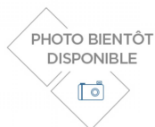
PHOTO BIENTÔT DISPONIBLE