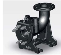
PIED D'ASSISE DN80 PN16