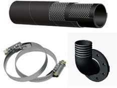
KIT ACCESSOIRES POUR POMPES AT / VT / DNA / DNB 80