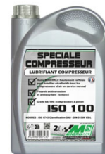
HUILE POUR POMPE HP BIDON DE 2L