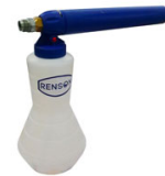
CANON A MOUSSE 2L STANDARD POUR DEBIT ENTRE 14 A 21L/MIN