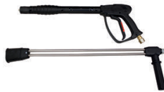
LANCE DOUBLE HAUTE PRESSION RACCORD TOURNANT 3/8 PACKAGE