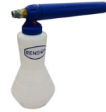
CANON A MOUSSE 2L STANDARD POUR DEBIT ENTRE 22 A 33L/MIN