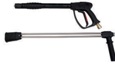
LANCE DOUBLE HAUTE PRESSION RACCORD TOURNANT 3/8 PACKAGE