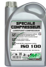
HUILE POUR POMPE HP BIDON DE 2L