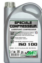
HUILE POUR POMPE HP BIDON DE 2L