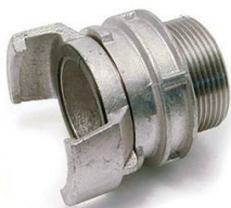
1/2 RACCORD MALE ALU AVEC VERROU DN80 3"