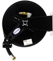
ENROULEUR ACIER POUR GASOIL EQUIPE FLEXIBLE 8M EN 1"