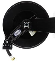
ENROULEUR ACIER POUR GASOIL EQUIPE FLEXIBLE 10M EN 3/4"