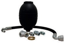
KIT ANTI COUP DE BELIER POUR NETTOYEUR HAUTE PRESSION