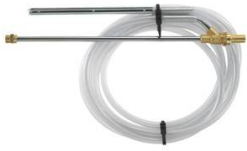
KIT DE SABLAGE CALIBRE 040 MALE EURO