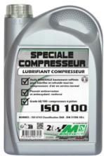
HUILE POUR POMPE HP BIDON DE 2L