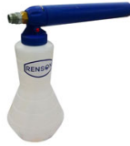
CANON A MOUSSE 2L STANDARD POUR DEBIT ENTRE 14 A 21L/MIN