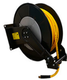
ENROULEUR AIR COMPRIME EQUIPE FLEXIBLE 15M EN 1/2"