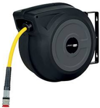
ENROULEUR AIR COMPRIME EQUIPE FLEXIBLE 15M EN 3/8"