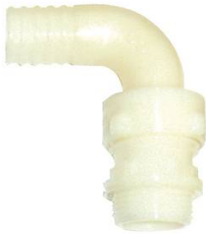
COUDE 3 PIECES CANNELE NYLON MALE 1" x 20