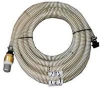
KIT ASPIRATION 7M Ø 20MM MALE 1" AVEC CREPINE A CLAPET