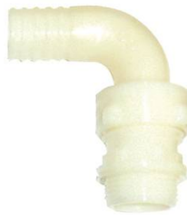
COUDE 3 PIECES CANNELE NYLON MALE 1" x 20