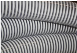
TUYAU SPIRALE - AU METRE DIAMETRE INTERIEUR - 55 MM