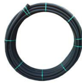
POL - COURONNE 50 M - 10 BAR DIAMETRE EXTERIEUR - 40 MM