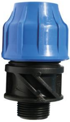
RACCORD COMPRESSION PP MALE 1"1/4 x 40