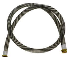
FLEXIBLE DE JONCTION Ø 25MM 1M AVEC RACCORD TOURNANT