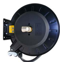
ENROULEUR ABS POUR GASOIL EQUIPE FLEXIBLE 10M EN 3/4"