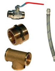
KIT BY-PASS 1" LAITON