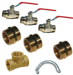
KIT BY-PASS 3/4" LAITON