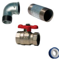
KIT DE PURGE 500 LITRES